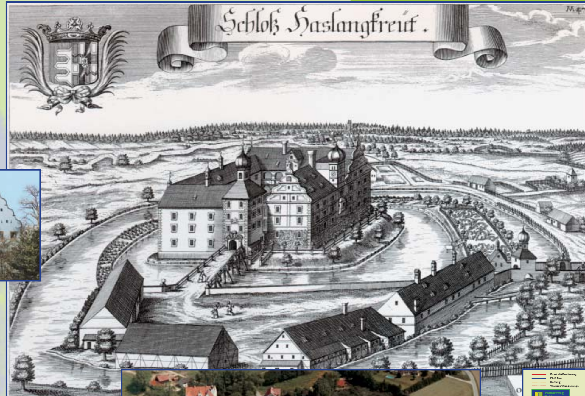
Stich von M. Wening, um 1700