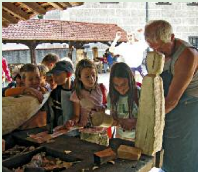
Sommerferienaktionstage für Kinder