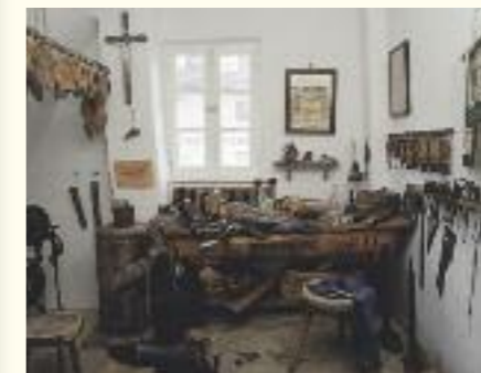
Bewahrte Tradition: Handwerkermuseum im Zeiselmairhaus Schrobenhausen

Eine Reihe außergewöhnlicher Museen bieten eindrucksvolle Einblicke in die Geschichte. Hier eine kleine Auswahl: Schlossmuseum in Neuburg, Zeiselmairhaus, Europäisches Spargelmuseum und Lenbachmuseum, Museum im Pflegeschloss in Schrobenhausen. Freilichtmuseum Donaumoos in Karlsruh. Römisches Museum in Burgheim.