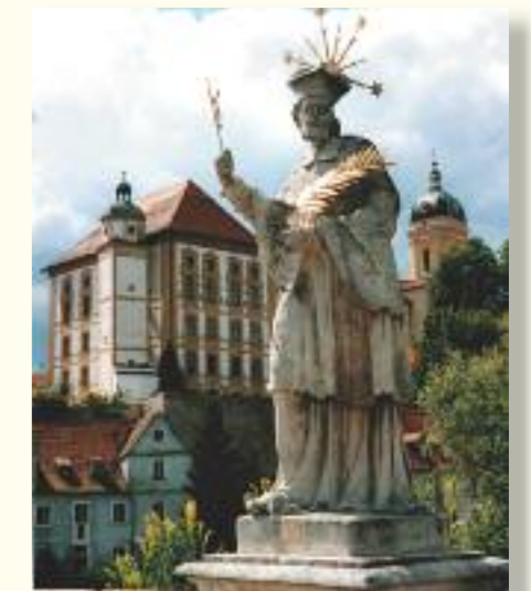
Schutzpatron der Brücken: Der heilige Nepomuk

club an den Abschlag. Auch Flugsport, Tennis, Squash und was man sonst noch gerne intensiv oder als Ausgleich in den Ferien betreibt, wird angeboten.