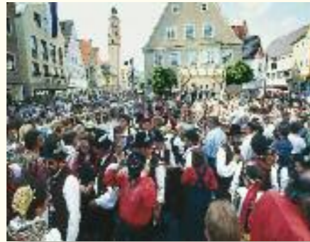
Immer am vorletzten Wochenende im Juni: Musik, Gesang und Tanz beim Schrobenhausener Schrannefest

Das Schrannefest in Schrobenhausen vermittelt seinen Besuchern einen guten Eindruck von Handel und Wandel in alter Zeit und von der Bedeutung, die der Markt für sein Umland gehabt hat. Hier wird das Flair, das Schrobenhausen auch heute noch umweht, deutlich spürbar.