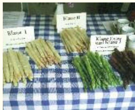
Alljährlich Treffpunkt für Genießer: der Spargelmarkt in Schrobenhausen

Der Schrobenhausener Spargel genießt Weltruhm. Der leichte und sandige Boden ist hervorragend geeignet, Spargel von sprichwörtlicher Qualität hervorzubringen. Wenn er gestochen wird, versammeln sich die Genießer aus allen Himmelsrichtungen, um sich von lukullischen Genüssen verwöhnen zu lassen. Die Spargelwochen von Mitte April bis Mitte Juni in Schrobenhausen sind Festtage, auch für den verwöhntesten Gaumen.