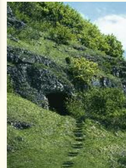
Spannender Einblick: Weinberghöhle bei Mauern

Für Freunde aktiver Erholung bietet die Ferienregion Neuburg-Schrobenhausen eine ganze Palette von Aktivitäten. Die Donau ist ein gesuchtes Revier für Paddler und Kanuten. Im bäuerlichen Kulturland mit weitem Blick wird das Reiten zum besonderen Vergnügen. Den Golfer lädt der Wittelsbacher Golf-