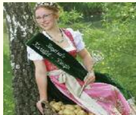
Ein Jahr lang Gebieterin über die vielfältige Knolle: die Kartoffelkönigin

Die Ferienregion Neuburg-Schrobenhausen gehört zu den größten Kartoffelanbaugebieten Bayerns. Auch diese Erdfrüchte lieben leichte, sandige Böden. Alljährlich zur herbstlichen Erntezeit lädt Neuburg zu Kartoffelwochen, deren Programm