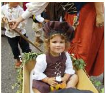
Ein Hoch der Renaissance: beim Schlossfest feiern Groß und Klein

Das Neuburger Schlossfest „Ein Fest der Renaissance“, ist ein buntes, lebhaftes Fest, das Jung und Alt,