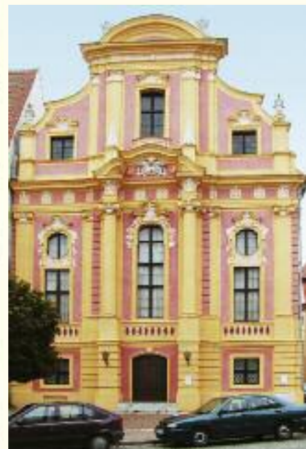
Inmitten der Neuburger Altstadt: Provincialbibliothek aus dem Frührokoko

Zu den wichtigsten Vorzügen der Ferienregion Neuburg-Schrobenhausen gehört, dass sie, noch abseits der großen Touristenströme, einen Urlaub voller Ruhe und Beschaulichkeit garantiert. Natur und Naturerlebnis wird groß geschrieben in diesem Bauermland, wo man die mühevollen Arbeit der Menschen mit und in diesem fruchtbaren Boden auf Schritt und Tritt verfolgen kann.