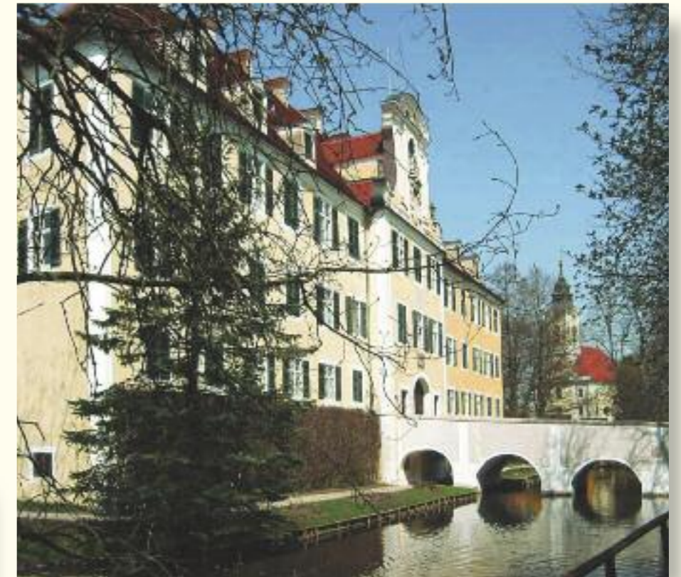
Schloss Sandizell mit Asamkirche

und das Schloss Sandizell nahe Schrobenhausen zeigen festliches Barock.