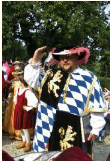
Ein großartiges Erlebnis: das Schlossfest in Neuburg an der Donau