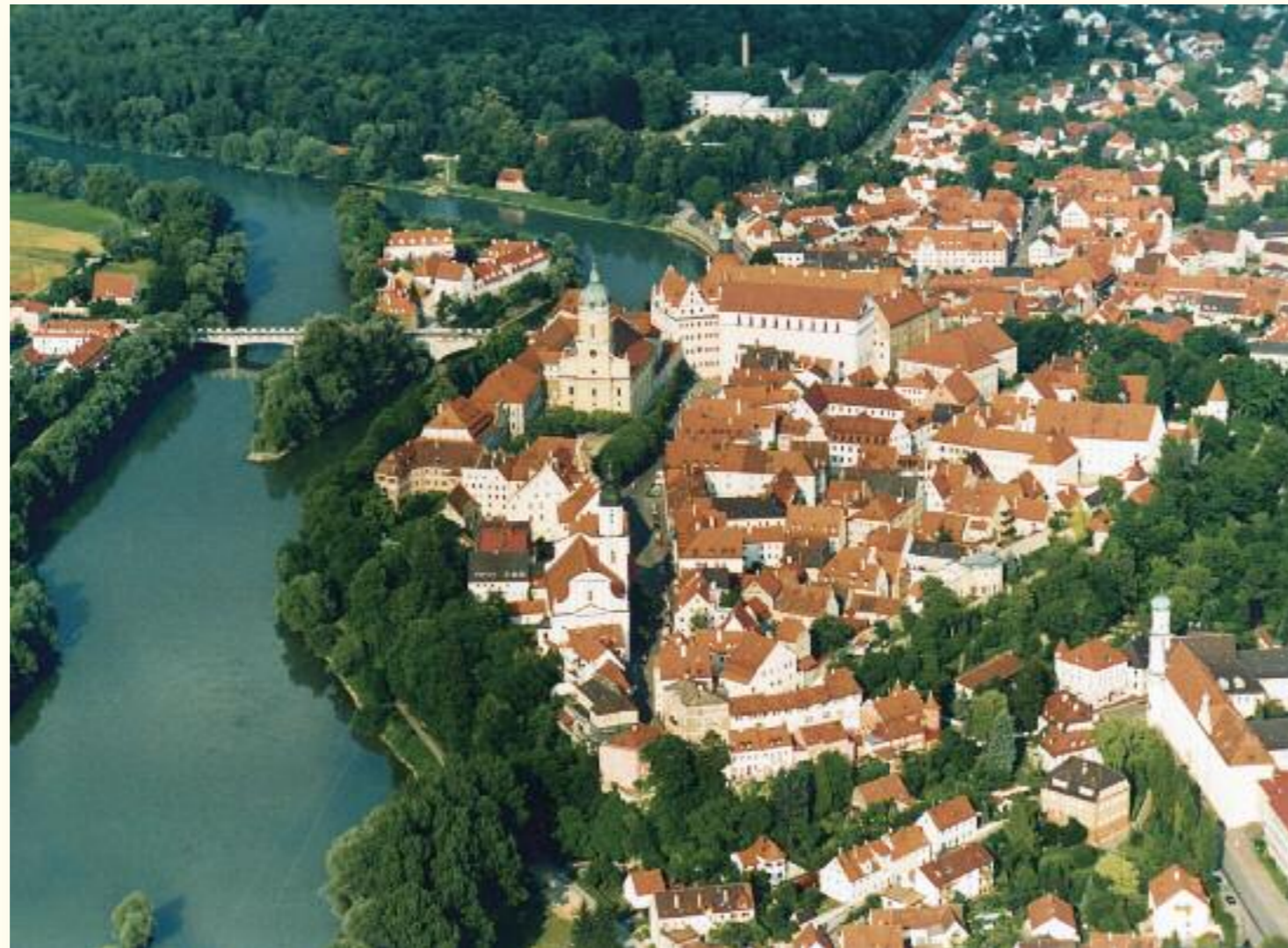
Ein kunsthistorischer Genuss: die Altstadt von Neuburg an der Donau

Flüsse, Bäche, Altwasser und Seen bestimmen den Charakter der Landschaft. Die bäuerliche Kulturlandschaft mit Feldern, Wiesen, Wäldern und un bebauten Talauen bietet ideale Voraussetzungen zur Erholung und Entspannung.