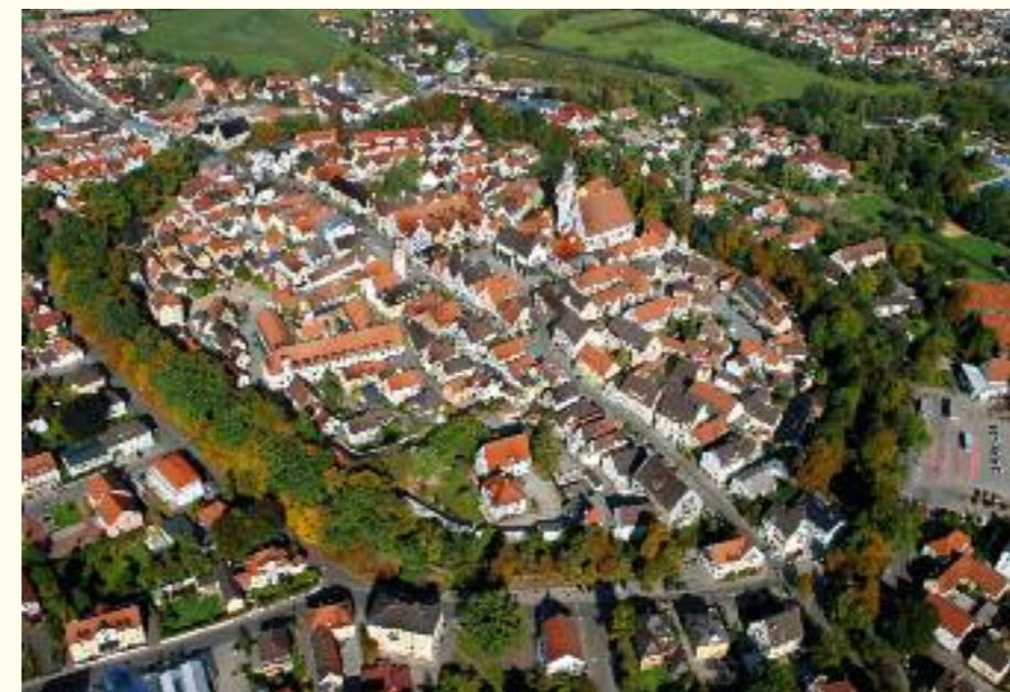
Die alte Handelsstadt Schrobenhausen: hier werden Kunst und Kultur gepflegt

Schrobenhausen, eine Künstlerstadt, die als Geburtsort des Malerfürsten Franz von Lenbach, seines