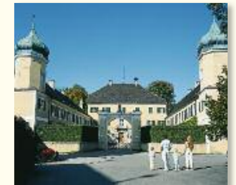
Barockes Schmuckstück: Schloss Stepperg

Die Rokokoausstattung der Schlosskirche von Sandizell wurde von Egid Quirin Asam mitgestaltet. Sie ist ein filigranes Beispiel für das Rokoko in Bayern, das man auch den „Augsburger Geschmack“ nannte. Die Wallfahrtskirche Maria Beinberg in Gachenbach, birgt mit dem Hochrelief „Mariae Tod“ ein spätgotisches Kunstwerk. Die Wallfahrtskirche Hl.-Kreuz in Neuburg-Bergen ist barockisiert, Turm und Krypta zeugen aber noch von den Anfängen der