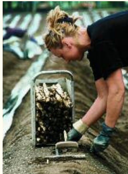
Frisch gestochen besonders gut: Schrobenhausener Spargel

Der Schrobenhausener Spargel genießt Weltruhm. Der leichte und sandige Boden ist hervorragend geeignet, Spargel von sprichwörtlicher Qualität hervorzubringen. Wenn er gestochen wird, versammeln sich die Genießer aus allen Himmelsrichtungen, um sich von lukullischen Genüssen verwöhnen zu lassen. Die Spargelwochen von Mitte April bis Mitte Juni in Schrobenhausen sind Festtage, auch für den verwöhntesten Gaumen.