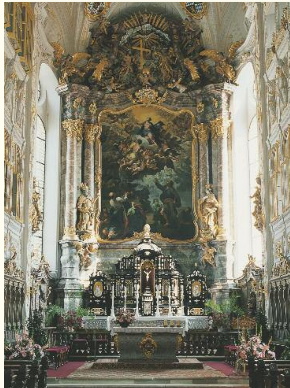
Der barocke Altar der Hofkirche in Neuburg: Zeugnis höfischer Prachtentfaltung

Nur wenige Kilometer außerhalb Neuburgs ließ sich Ottheinrich das Jagdschloss Grünau mit Wall und Graben errichten. Ein Stück weiter donauaufwärts baute Gabriel de Gabrieli das dreiflügelige Bertoldsheimer Schloss auf einen Jurafelsen über dem Fluss. Es gilt als einer der bedeutendsten Barockbauten im bayerischen Schwaben. Auch die Wallfahrtskirche Maria Beinberg