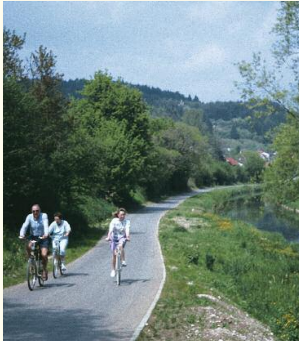
Ob eben oder hügelig: Touren für jeden Geschmack

Das Donaumoos ist die perfekte Radstrecke für alle, die es gerne flach und eben haben. Hier gibt es kaum Anstrengungen. Anders ist es um Schrobenhausen. Die Hügel sind zwar nicht steil, machen den Radausflug aber sehr abwechslungsreich. Der Donau-Radwanderweg, der von Donaueschingen hinauf bis nach Passau führt, findet in Neuburg Anschluss an das umfangreiche Radwegenetz