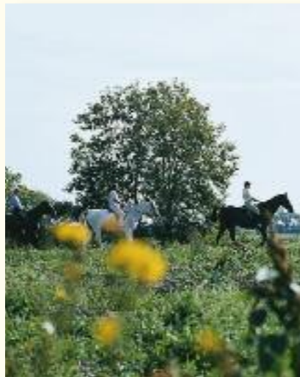
Weites Land: Hier wird jeder Ausritt zum Genuss

des Naturparks Altmühltal, der den nördlichen Teil unserer Region einschließt sowie an den Amper-Alt-mühl-Weg und den Paartalweg.