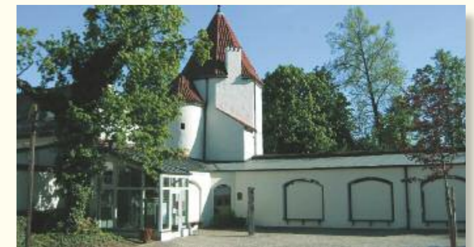
Europäisches Spargelmuseum Schrobenhausen